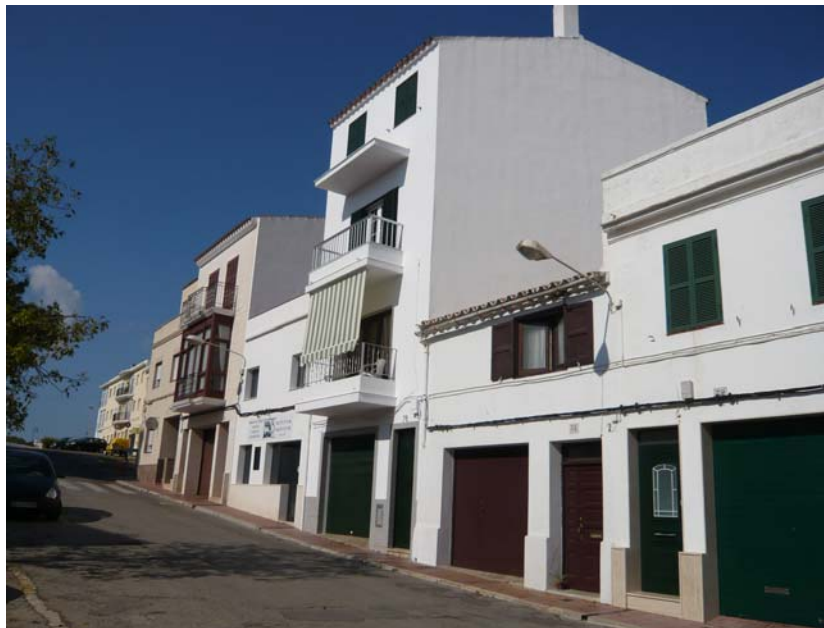
TIPOLOGIA D'EDIFICACIÓ ALS NOUS BARRIS DESCATALOGATS