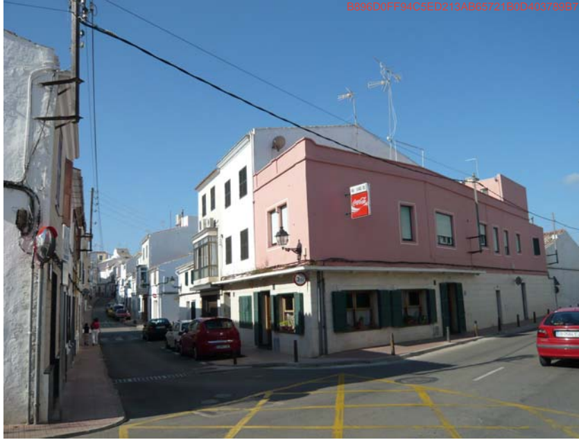
TIPOLOGIA D'EDIFICACIÓ ALS NOUS BARRIS DESCATALOGATS